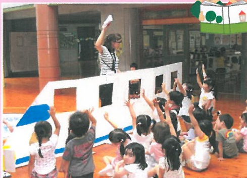
しんかんせん ～わたしは まえから Oばんめ～