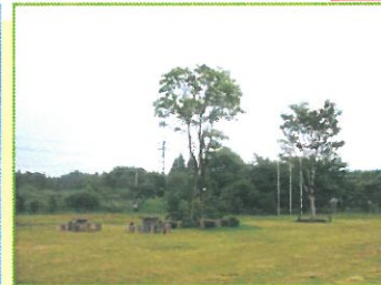
阿蘇子どもの文化の森