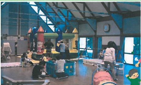
子育て支援 “のびのび”